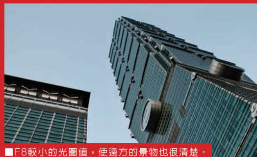
■ F8較小的光圈值，使遠方的景物也很清楚。