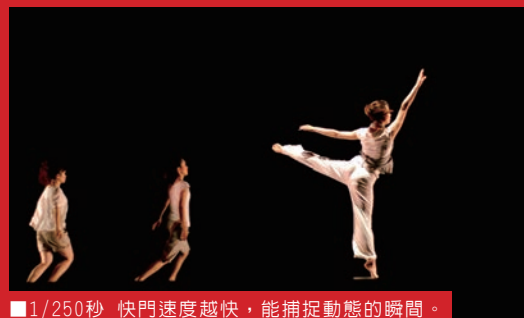
■ 1/250秒 快門速度越快，能捕捉動態的瞬間。