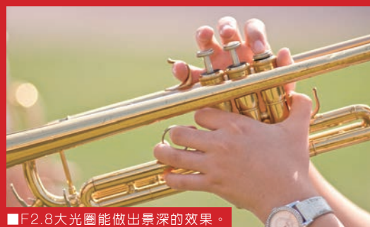
■ F2.8大光圈能做出景深的效果。