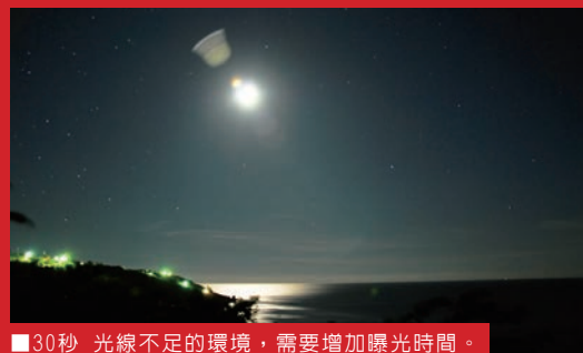
■ 30秒 光線不足的環境，需要增加曝光時間。