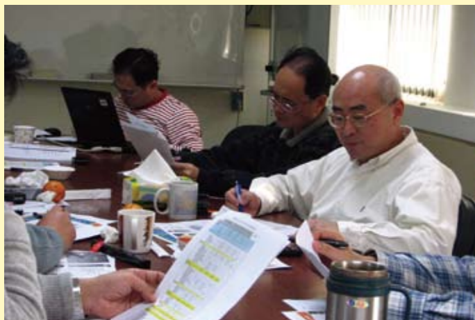
「東海大學資工系數位創意社群」研討規劃數創課程的應用

為建立教師間教學經驗的分享與對話，鼓勵本校教師自發性成立教師專業成長社群，以提升教學能力及教學專業成長。教師社群採每學期申請，由專、兼任教師4至8人以上組成，並由一位專任教師擔任社群召集人，討論主