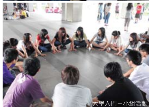
大學入門－小組活動