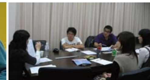
履歷自傳工作坊諮商，同學認真聆聽老師解說