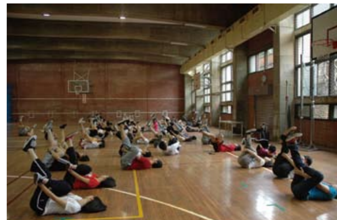
透過體能檢測、體育補救教學等方案，協助學生養成良好運動習慣與體能訓練