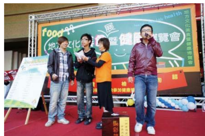
每年舉辦的地方美食展由學生們一手促成

2011年子計畫3將繼續以學務處爲主軸單位，連結校內系所與行政單位，並建構資訊平臺，落實博雅學習的精神，建立宿舍生活學習社群；強化原有學習輔導機制，推動各系新生定向輔導；以新生家長與高中生爲主軸的系列活動，串連表演藝術月，連結東海與家長、高中生、社區民眾的情感，也讓更多的人了解東海大學的博雅學習特色；延續大學入門，鼓勵學生參與相關活動，逐漸開展博雅學習，建立核心價值；透過珍貴的影音文字記錄，將東海立校精神、博雅學習價值永留東海人心中。期望在新的年度，透過子計畫3的經營與努力，落實東海精神，在實踐自我的同時亦能成就他人。✎