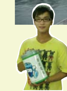
隨手回收電池很重要喔！