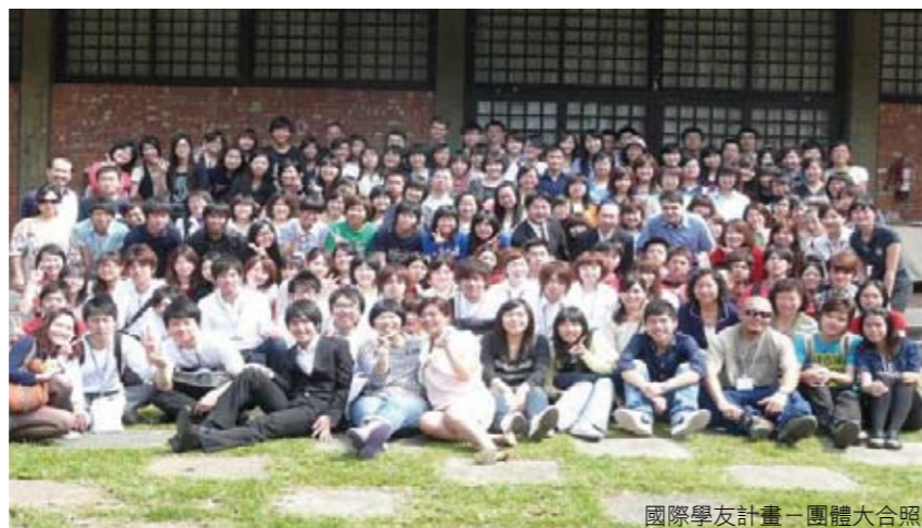
國際學友計畫－團體大合照

其中，最深受好評的TVT Program，開設有英、日、韓、德、泰及法文等外語課程，共計有22名Tutor、292位學員，授課總時數達432小時，提供學生參與海外研習及其他出國進修前的語文強化訓練。此外，英語中心之線上英語檢測系統（OEAS）、日文系線上聽解能力測驗、中文