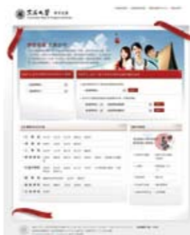
動態課程地圖為學生指引選課及職涯方向

在協助學生進行職涯探索與生涯規劃方面，本校以動態課程地圖 ( http://coursemap.thu.edu.tw/ ) 作為主體架構，以系所為單位，提供課程分類、專業養成歷程、學群規劃與就業、課程搜尋、課程花絮與連結t-Portfolio（數位學習歷程檔案）等功能。尤其，系統特別加強各系課程、學生核心能力與未來職涯發展三者的緊密連結，亦完整呈現新版課程大綱中相關課程資訊，相信課程地圖的運行將可指引學生修課方向，連結未來職涯發展，讓學生提前規劃未來就業力並了解多樣化升學管道；而對於大學的選擇上，不論是基礎課程、通識課程，甚至在各個專業領域上，均能提供「未來新生」完善清晰的課程擊劃。