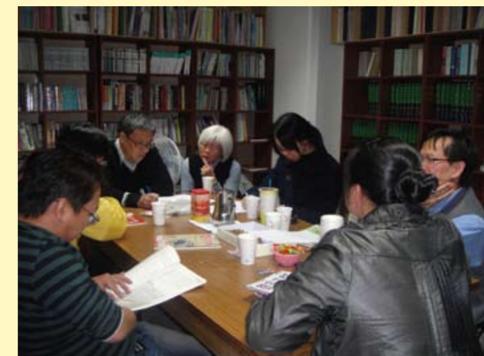
「大一國文古典小說專題教學分享與改進計畫」教師社群聚會討論實況

考量各院系所差異性，98學年度本校依各院不同教學性質、方式與學制，將原先單一教學評量問卷，增修為19種各具教學特色的教學評量版本，並擴大教學評量的適用課程，進而落實教學評量機制課程檢討的功效。期中學生學習意見反映亦與期末教學評量並行，學生透過數位教學平臺，即可對每位教師所開授的課程內容與授課方式提出