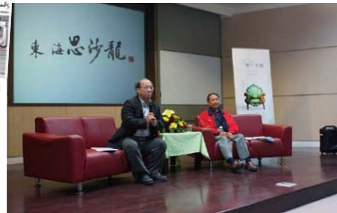
東海思沙龍活動主題包含文化、政治、環保、性別議題等，激盪出學生新想法，也強化其觀察與探討能力間接促進學生自發且自主的學習動機