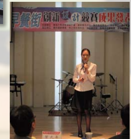
早餐街創新設計競賽布雷克團隊正聚精會神地向評審報告

美邦人壽、永豐餘、中龍鋼鐵、中僑花園飯店等數十家企業；活動也獲得中區職訓局肯定與補助，並預計於100年度進一步連結更多大專院校進行辦理。99學年度該活動的團隊競賽已於100年4月8日發表成果並圓滿結束，共有6隊優秀團隊獲選。