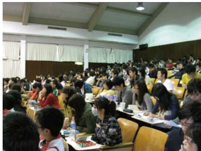
▲履歷自傳工作坊諮詢，同學認真聆聽老師解說 ▼志工教育訓練，志工們活力合影

推動企業實習計畫：為使各系所同學提早了解企業職場就業內容，將透過教務處、就業輔導暨校友聯絡室以及東海34系所、子計畫6、7、8等單位籌劃與整合，共同推展企業實習計畫，以協助學生於畢業前對於就業實務的認知與接觸。✎