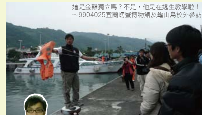
這是金雞獨立嗎？不是，他是在逃生教學啦！ ~99/04/025宜蘭螃蟹博物館及龜山島校外參訪