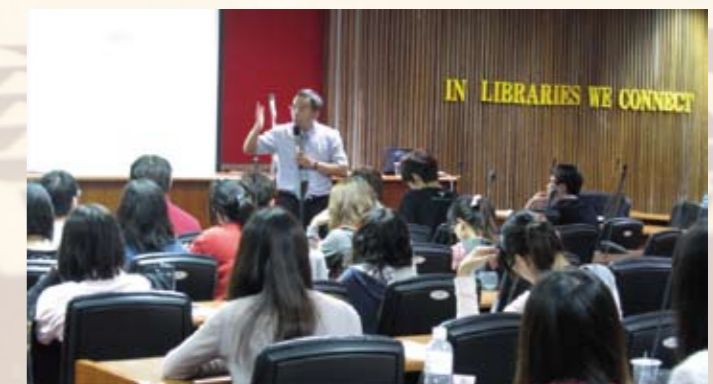
學生專心的聽老師演講

到6月5日每周六舉辦，經過修習完整課程之學生，畢業時將獲得優先推薦至相關優良企業的機會。而有鑑於臺灣逐步邁入失業率攀升與所得差距拉大的M型社會，因此本校執行教學卓越計畫中的創新育成中心在98年底舉辦了跨領域人才養成研習營。期望透過課程之設計規劃，能夠培養出融合理論與實務，兼具科技、管理、藝術知識與文化素養之跨領域人才。✎