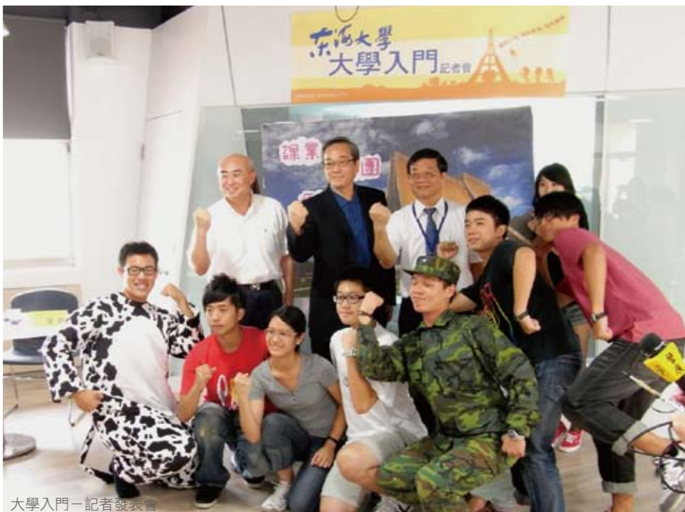
大學入門－記者發表會