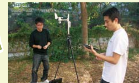
裝設飛彈!?不用擔心，他們是在進行空污監測

MII、社科院、外文系、圖書館燈具為T5燈具，並在學生宿舍及教學區廁所開關進行節能方案，節省電力使用；同時設置有機堆肥場，製作有機肥料並透過教學讓學生參與有機堆肥之實習及提供校內外團體參訪分享經驗。