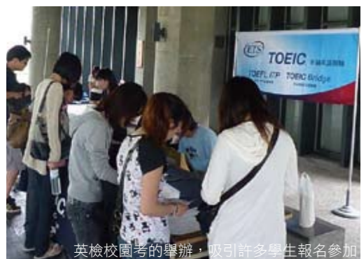
英檢校園考的舉辦，吸引許多學生報名參加

在2009至2010年建置的基礎下，新年度的職涯思維將透過延續與創新的方式，持續推動以下就業促進內容，使子計畫具有創新性並有助於職涯輔導機制再度啟動：